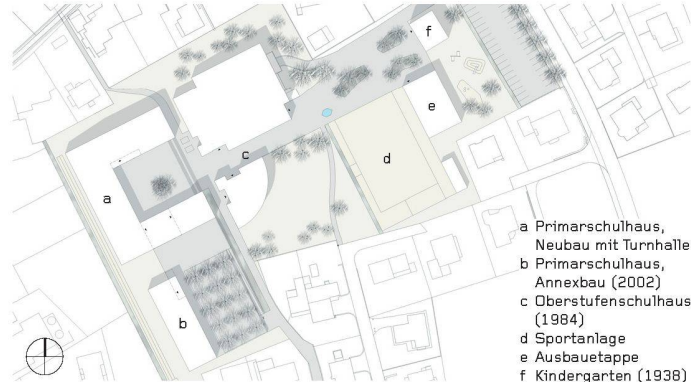
01+02 «Erlenstrauß»: Der Neubau fasst dreiseitig den Pausenhof, südlich vermittelt die Pausenhalle zum Annexbau

(af) Das alte Primarschulhaus in Untervaz – 1959 errichtet – soll abgerissen werden. Die Gemeinde lud 15 präqualifizierte Teilnehmende zu einem Projektwettbewerb für den Ersatzbau mit Turnhalle. Mit Lärchenholzschindeln verkleidet präsentiert sich das Siegerprojekt «Erlenstrauß» von Hans Oeschger und Walter Bieler. Neben der guten städtebaulichen Einbindung und der gelungenen inneren Organisation lobt die Jury die umfas-