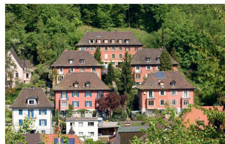
01–03 «Lokalmatador» Hans Loepe: drei Einfamilienhäuser am St. Annaweg, sein eigenes Haus im Stil des Neuen Bauens am Mühlbergweg 27 (1934/35) und die Siedlung an der Sonnmattstrasse 16 bis 38 (1925–1928)

Baden hat ein vielfältiges bauliches Erbe von hoher Qualität. Mit der Überarbeitung des Inventars schützens- und erhaltenswerter Bauten wird der Leitfaden zum Umgang mit diesen Zeugen aktualisiert.