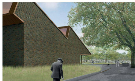
03 «Freund Hein»