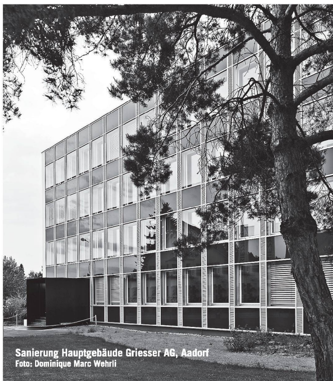
Sanierung Hauptgebäude Griesser AG, Aadorf

Preis und Leistung stehen bei uns täglich im Mittelpunkt. Geringere Kosten bedeuten nicht automatisch weniger Qualität oder mangelnde Flexibilität. Fragen Sie uns an.