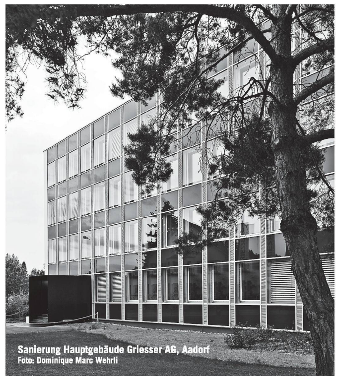
Sanierung Hauptgebäude Griesser AG, Aadorf

Biotech Energietechnik AG, Vertrieb Schweiz: Huggler Energietechnik ●● Nollenhornstrasse 7, 9434 Au/SG, 071 740 16 83, Fax 071 740 16 84, Büro Mittelland: H.P.Kummer, 3269 Arch, 079 340 90 57, office@biotech-energietechnik.ch , www.biotech-energietechnik.ch