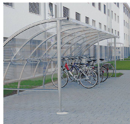
Elegant und feingliedrig: Überdachung «Omega».

Getrieben von der Entwicklung der Fahrräder selbst sowie durch Mobilitäts-Trends hat Velopa auch heute zukunftsweisende «Pfeile im Köcher». Beispiele dafür sind neue Zutrittssysteme sowie Elektrovelos. Zudem unterstreicht das Unternehmen seine inzwischen internationale Ausstrahlung. Bereits im Jahr 1997 wurde die Velopa France gegründet, und seit April 2009 ist die Tochtergesellschaft «1a-parken» von Rheinfelden aus in Deutschland operativ.