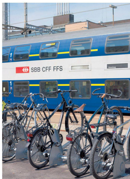
Velopa-Handschrift an vielen Schweizer Bahnhöfen.

Für die Entwicklung individueller Lösungen ist Velopa der Ansprechpartner für Planer, Architekten und Bauherren. Das gut entwickelte architektonische «Auge» der Velopa-Berater hilft, ein Hauptbedürfnis der Auftraggeber zu erfüllen: das optimale Einpassen von Unterständen und Parkieranlagen in die Umgebung.