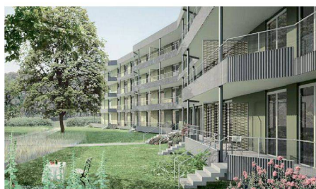
01–03 Siegerprojekt «Regina»