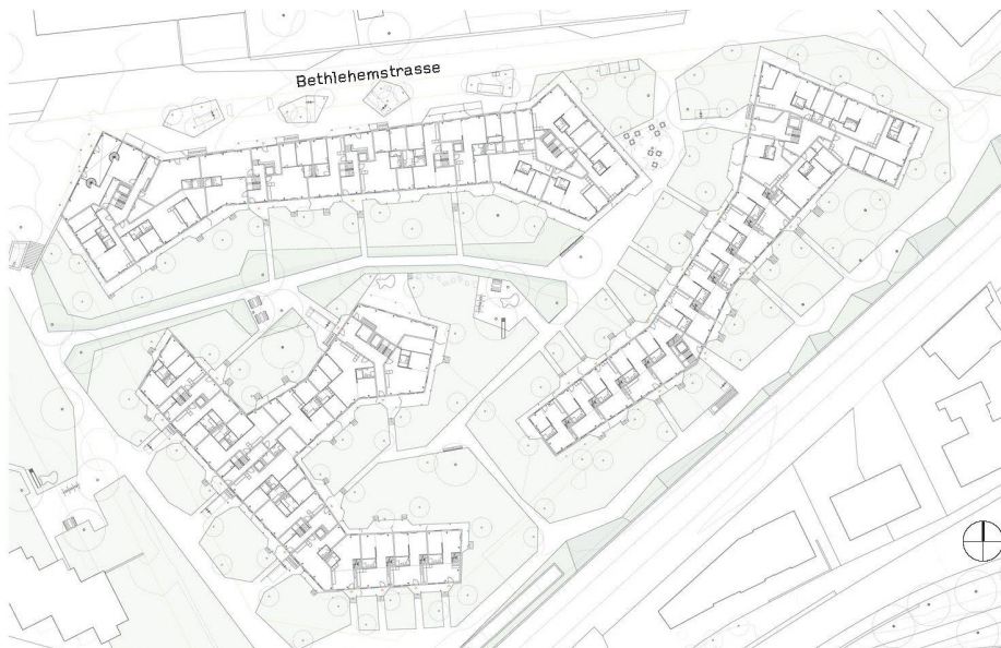
03 EG-Grundriss: Geschoss-, Alterswohnungen und Townhouses gemischt (Meier + Hug Architekten)