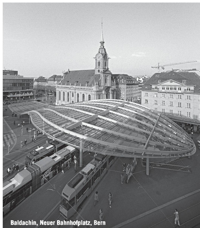
Baldachin, Neuer Bahnhofplatz, Bern

Partner für anspruchsvolle Projekte in Stahl und Glas