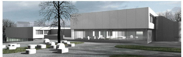
05 «Cocon» (Erдин &amp; Koller Architekten, Baden)