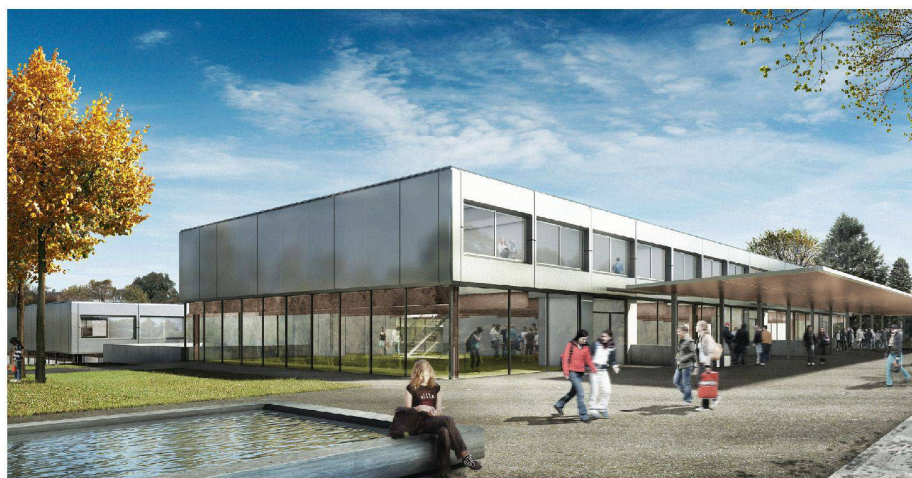
01 Siegerprojekt «Plötzlich diese Übersicht»: Eingangssituation (Egli Rohr Partner, Baden Dättwil)

Die insgesamt sieben eingereichten Arbeiten belegen, dass trotz dem eng gefassten Gestaltungsrahmen und dem bauphysikalisch-technischen Schwerpunkt der Aufgabenstellung von architektonischen Fragestellungen definierte Konzepte auf hohem Niveau entwickelt werden konnten. In Anbetracht der Tatsache, dass Sanierungsmassnahmen zukünftig einen Grossteil der Aufträge für Architekten darstellen werden, darf man hoffen, dass die Qualität der Beiträge Anreiz zur Teilnahme an vergleichbaren Wettbewerbsauslobungen sein und die Teilnehmer-