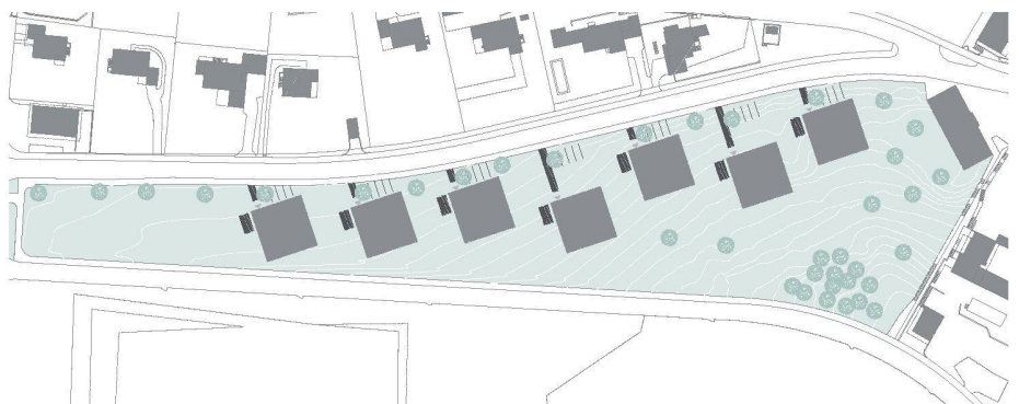
04 «Alea» (Oberst & Kohlmeier Generalplaner, D-Stuttgart)