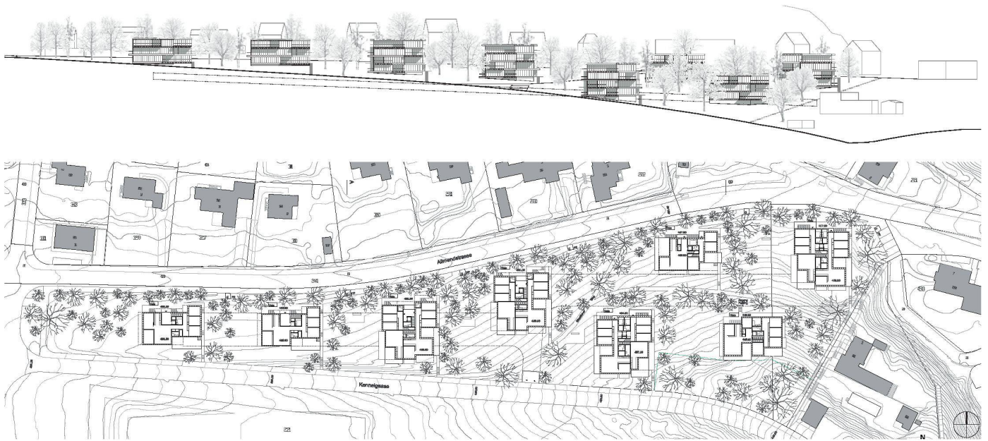
01 Siegerprojekt «Baumhütten»: Südansichten und Erdgeschossgrundriss (Azzola Durisch Architekten, Zürich)

Schöne Aussichten auf Baden – zumindest für die künftigen Bewohner des neuen Quartiers. Der attraktive Ausflugsort soll nach den Plänen der Architekten Roberto Azzola und Thomas Durisch sowie der Landschaftsarchitekten Rita Illien und Klaus Müller bebaut werden: In einem Hain entstehen acht einzelne «Baumhütten» mit Familienwohnungen.