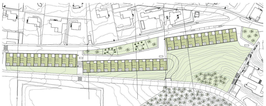
03 «Valldemossa» (LVPH architectes, Pampigny)