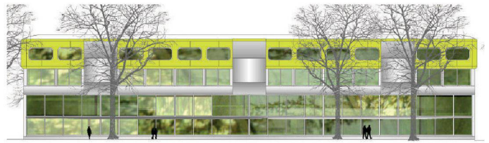
06 «Camouflage» (Hunkeler Hürzeler Architekten, Baden)