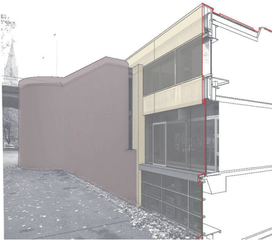
03 «Bricolage brillant» (Diethelm &amp; Spillmann Architekten, Zürich)