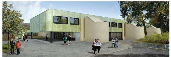
07 «Hybrid» (Gianesi + Hofmann, Zumikon)