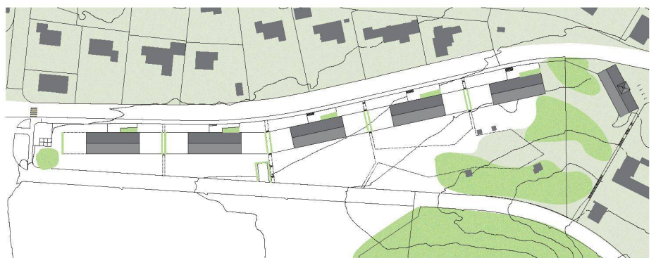
05 «Rimap» (Hunkeler Hürzeler Architekten, Baden)