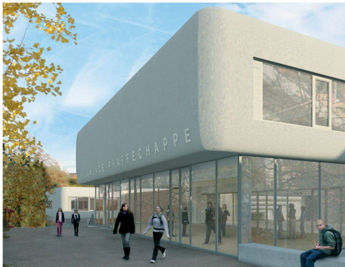
04 «body and soul» (AMA Ackerknecht Minder Architekten, Zürich)