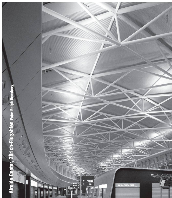
Airside Center, Zürich-Flughafen

Emil Keller AG Tiefbauunternehmung Inhaber André Oberhänsli Neumühlestrasse 42 Tel. 052 203 15 15 / Fax 052 202 00 91 8406 Winterthur / 8460 Marthalen www.emil-keller.ch