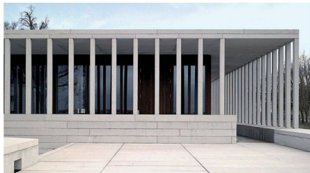
01 Literaturmuseum in Marbach von David Chipperfield

(pd/jk) Der britische Architekt David Chipperfield spricht am 25. November in Basel über seine Arbeit. Einige Beispiele sind das Figge Art Museum in Davenport, USA, das preisgekrönte River and Rowing Museum in Henley-on-Thames und das Literaturmuseum der Moderne in Marbach. Für Letzteres wurde Chipperfield mit dem Stirling-Preis ausgezeichnet. Derzeit projektieren David Chipperfield Architects ein Gebäude auf dem Novartis