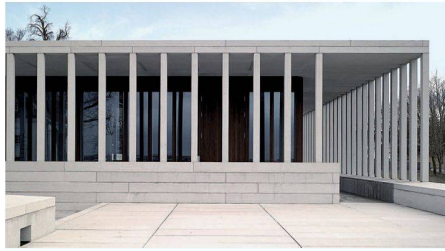
01 Literaturmuseum in Marbach von David Chipperfield

(pd/jk) Der britische Architekt David Chipperfield spricht am 25. November in Basel über seine Arbeit. Einige Beispiele sind das Figge Art Museum in Davenport, USA, das preisgekrönte River and Rowing Museum in Henley-on-Thames und das Literaturmuseum der Moderne in Marbach. Für Letzteres wurde Chipperfield mit dem Stirling-Preis ausgezeichnet. Derzeit projektieren David Chipperfield Architects ein Gebäude auf dem Novartis