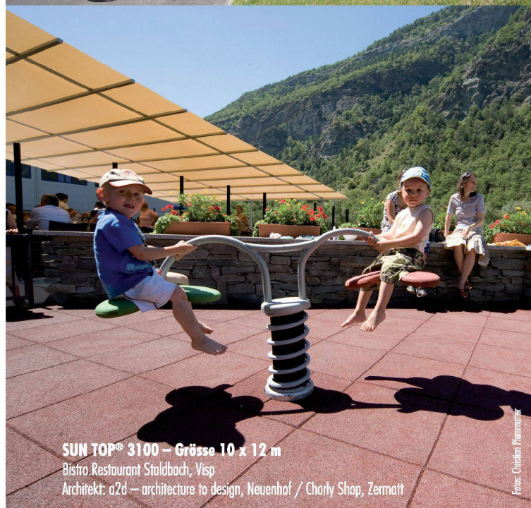
SUN TOP® 3100 – Grösse 10 x 12 m