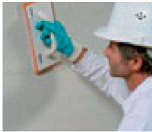
8. Der jeweilige Sanierputz wird mit dem Schwammbrett abgerieben. Wenn die Oberfläche rapportiert werden soll ist eine Überarbeitung mit dem Remmers Feinputz notwendig.

Im Zuge mit der stetigen Raumerweiterung erschliessen wir täglich frühere Neben- und Kellerräume als Lebensräume. In diesem Zusammenhang stellen die Gegebenheiten hohe Anforderungen an die Planenden und die Verarbeiter, sowie an die Materialindustrie. Ein geschickter Einsatz der zur Verfügung stehenden Möglichkeiten garantiert so ein Gelingen seines Vorhabens.