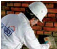
2. Aufbringen der Haftbrücke mit Remmers Sulfatexschlämme schnell während der Kiesol-Reaktionszeit.