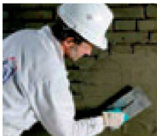
3. + 4. In die frische Haftbrücke wird der Remmers Dichtspachtel eingebracht. Egalisierung und Hohlkehle bis 50 mm Schichtdicke finden in einem Arbeitsgang statt.