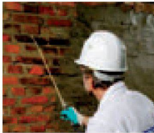
1. 09:30 Uhr: Grundierung des vorbereiteten Untergrundes mit Kiesol 1:1 mit Wasser. Stark saugende Untergründe sind vorzunässen.