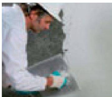
7. 13:00 Uhr: Ohne vorherigen Spritzbewurf kann als Oberflächenschutz der normal- oder schnellabbindende Remmers Sanierputz oder wahlweise auch die Remmers Schimmel-Sanierplatte aufgebracht werden.