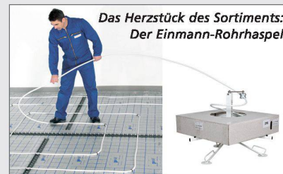
Das Herzstück des Sortiments: Der Einmann-Rohrhaspel

Neben der bewährten Servicequalität unterstreicht Prolux damit seine Kompetenz auch im Flächenheizungsbereich.