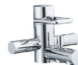
arwa-twin Bademischer Anschlussdistanz 153 mm