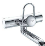
arwa-class Wandmischer Anschlussdistanz 120 mm oder 153 mm