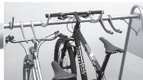
Das Lenkerhaltesystem sorgt für Ordnung und guten, schonenden Halt der Fahrräder.

Ihr servicestarker Partner mit innovativen Lösungen: