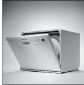
Die kompakte Lösung.