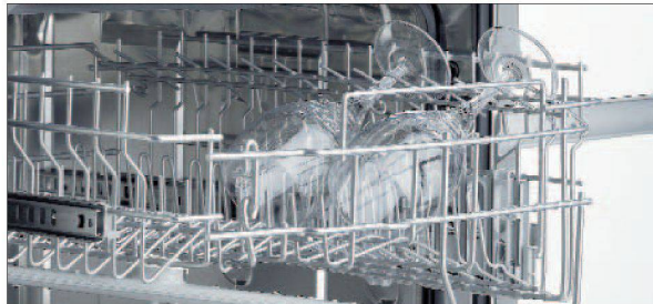
Komfortable Bedienung des Oberkorbs.