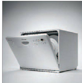
Die kompakte Lösung.