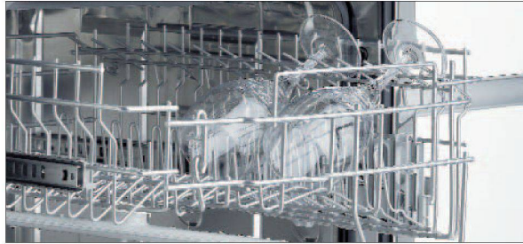
Komfortable Bedienung des Oberkorbs.