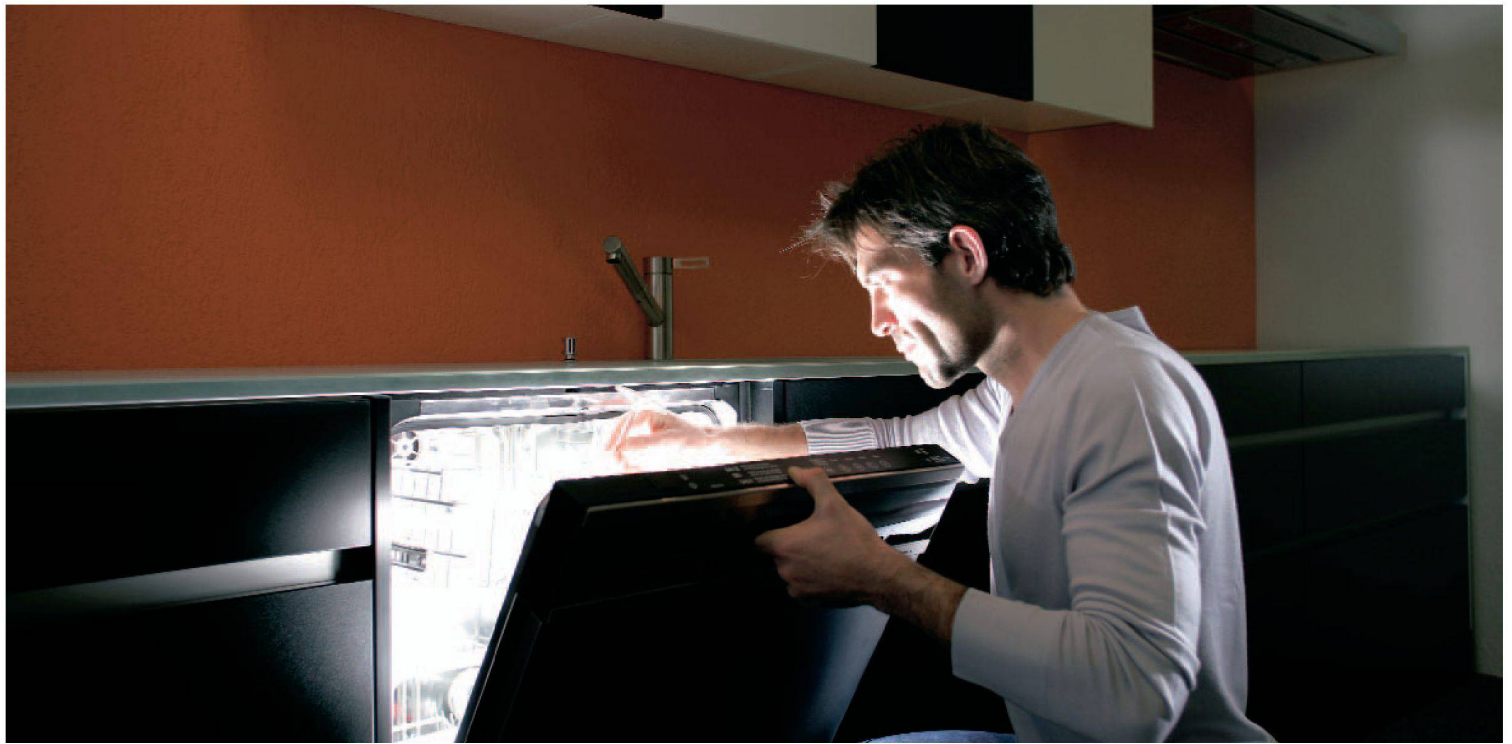
Einfach schön, wenn Teller und Gläser im richtigen Licht erscheinen: Die komfortablen Electrolux-Geschirrspüler machen es möglich.