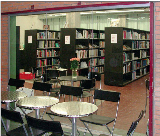
Hochschule der Künste Bern, Metallbau: K. Zimmermann AG