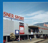
Media Markt, Conthey