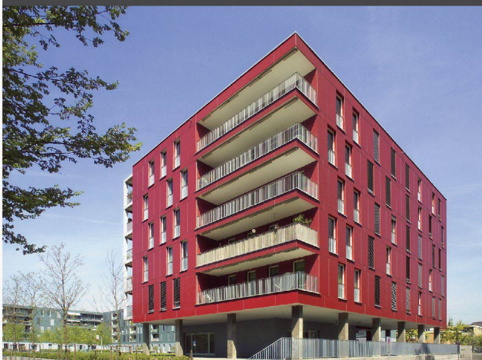
Architekten: Tina Arndt, Daniel Fleischmann, Zürich

Die Auseinandersetzung mit Funktion, Raum und Proportionen als kreativer Prozess. Die Wahl des Materials als entscheidendes Element einer konsequenten Umsetzung.