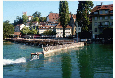
Stirnwehr mit 3.5 Meter langen Holznadeln

Im Kanton Luzern brauchte es eine Abstimmung, weil ein Komitee aus der Stadt die Sanierung mit dem Referendum bekämpfte. Es wollte die bestehende Wehranlage wieder instandsetzen und wehrte sich gegen die Ausbaggerung und die Baustelle in der Altstadt. Das Komitee befürchtete, dass der Fluss grösstenteils durch das Kraftwerk am Mühlenplatz umgeleitet wird sowie negative Fol-