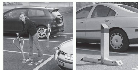
Robust, zuverlässig: «Autopa» für manuelles und «CityParker» für automatisches Sichern des Parkfeldes.

Ihr servicestarker Partner mit innovativen Lösungen: