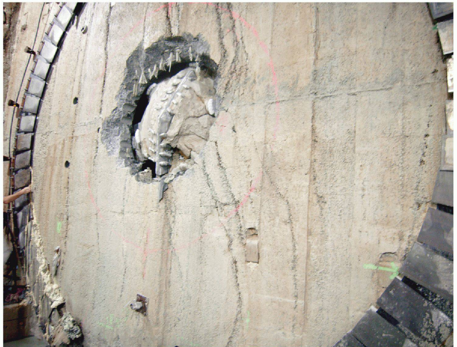
02 Eine Tunnelbohrmaschine durchbricht ein mit GFK-Stäben bewehrtes Soft-Eye in einem Baugrubenabschluss

Der Bewehrungskorb eines Soft-Eyes lässt sich auf konventionelle Art montieren. Die GFK-Stäbe werden in der nötigen Länge und Form auf die Baustelle geliefert. Wie bei Stahlbewehrung üblich, können auch hier für die Verbindung der GFK-Stäbe Drähte oder ähnliche Produkte verwendet werden. Für den Übergang von GFK-Stäben zu Stahlstäben und sonstigen hoch belasteten Verbin-