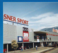
Media Markt, Conthey