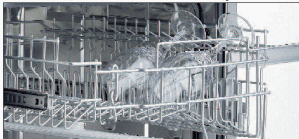
Komfortable Bedienung des Oberkorbs.