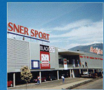
Media Markt, Conthey