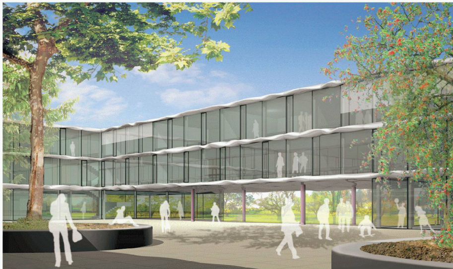
01 Siegerprojekt «Pépinère» (Voelki Partner Architekten, Zürich)

Durch Erweiterung der bestehenden Schulbauten soll eine neue Gesamtschule in Uster entstehen. Cluster oder Campus waren die häufigsten Lösungsansätze der Teilnehmer beim Projektwettbewerb. Mit grosser Mehrheit entschied sich die Jury für die kräftige Grossform des Teams um Peter Voelki aus Zürich.