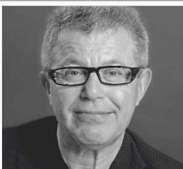
Prof. Daniel Libeskind, New York

Die contractworld 2008 in Hannover – Treffpunkt für den intensiven fachlichen Austausch über Themen aus den Bereichen Office, Hotel und Shop.