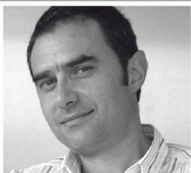
Alejandro Zaera Polo, London