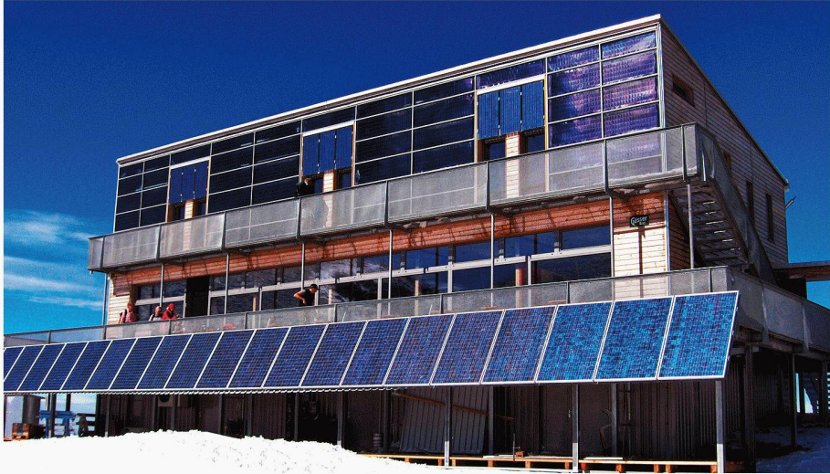
Dank Sonnenkollektoren und Fotovoltaikanlage, Regenwassergewinnung und biologischer Abwasserreinigung ist die Schutzhütte Schiestlhaus (Steiermark) völlig autark (Bild: Treberspung & Partner Architekten)

In einem Wissenstransferprojekt hat die Internationale Alpenschutzkommission, Cipro, alpenweites Erfahrungswissen zu Projekten gesammelt, die Naturschutz, Bedürfnisse der Bevölkerung und wirtschaftliche Ziele in Einklang bringen. Dieses Wissen steht nun allen Interessierten zur Verfügung und soll Impulse für eine nachhaltige Entwicklung in den Alpen geben.