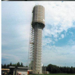
Behälter- und Bäderbau