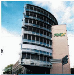
Gewerbe- und Wohnbau