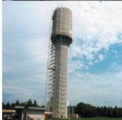
Behälter- und Bäderbau