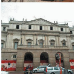
Neubauten in und an bestehenden Bauten

Durch die über 40-jährige Erfahrung und Spezialisierung auf vorbeugende und sanierende Abdichtung gegen drückendes Wasser, sowie ständige Weiterentwicklung der Produkte und Lösungen, können Sie mit RASCOR nur gewinnen.