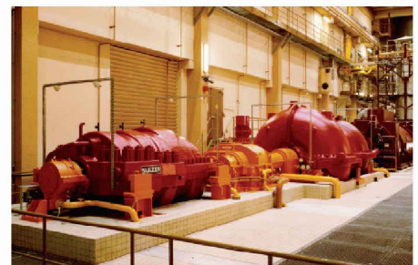
02 Der zweistufige Kompressor des Luftspeicher-Gasturbinen-Kraftwerks Huntorf. Im Hintergrund rechts schliessen Generator und Gasturbine an