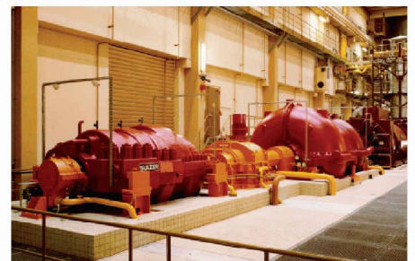
02 Der zweistufige Kompressor des Luftspeicher-Gasturbinen-Kraftwerks Huntorf. Im Hintergrund rechts schliessen Generator und Gasturbine an