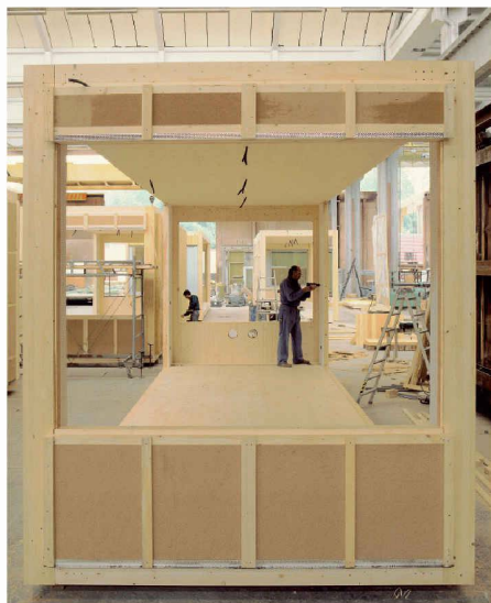
Praxisorientierte Forschung und Entwicklung haben im Holzbau zu einem hohen Stand der Vorfertigung geführt. Im Bild die Produktion von «Zürich-Modular», Schulbauten für 26 Standorte in der Stadt Zürich nach dem Konzept von Bauart Architekten, Bern

Auf nationaler Ebene sollen Forschung, Entwicklung und Innovation im Zusammenhang mit dem Werkstoff und Energiespender Holz koordiniert werden. Die zu diesem Zweck vor zwei Jahren aufgelegte «Innovations-Roadmap 2020» (TEC21 Nr. 26/2006, S. 34) nimmt Formen an.