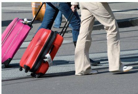
01 Zu Fuss vom Parkplatz zum Ziel: Werden für einen Weg verschiedene Verkehrsmittel benutzt, spricht man von kombinierter Mobilität