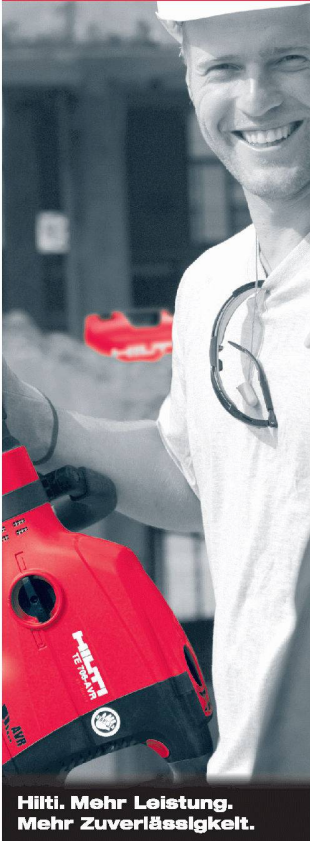
Hilti. Mehr Leistung. Mehr Zuverlässigkeit.

Wir begeistern unsere Kunden und bauen eine bessere Zukunft. Dabei leben wir unsere Werte: Integrität, Mut zur Veränderung, Teamarbeit und hohes Engagement. Für den Profi am Bau bieten wir innovative Lösungen mit überlegenem Mehrwert. Und dies in 120 Ländern.