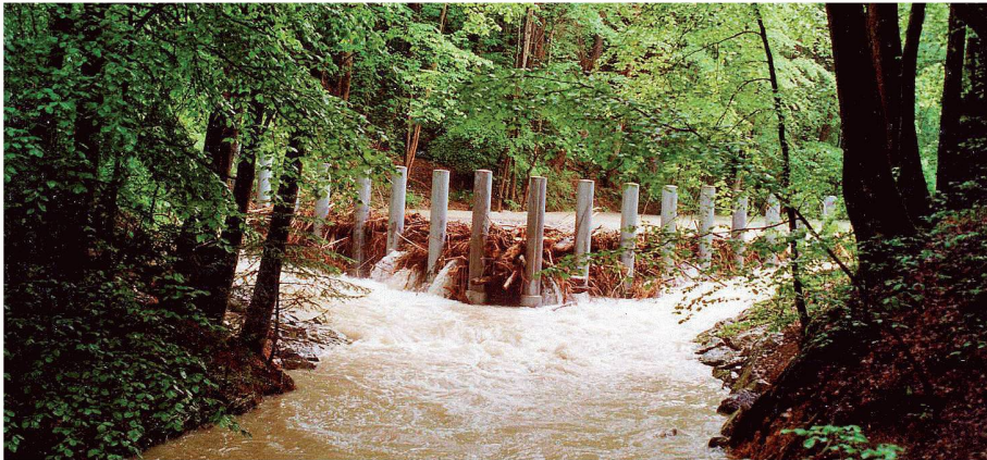
01 Chämptnerbach in Wetzikon Kempten: Der 1997 gebaute, V-förmige Schwemmholtzrechen hat sich bei den Hochwassern von 1999, 2005 und 2007 bewährt

Bei Hochwasser ist Schwemmholtz oft ein Problem. An einer Tagung in Zürich wurden verschiedene Lösungsansätze aufgezeigt.