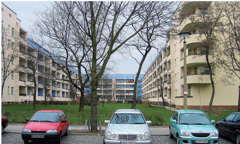
01 Wer wohnt im Weltkulturerbe? In der renovierten Wohnstadt Carl Legien (Bruno Taut 1928–30) hat der Bezirk Berlin Pankow für Mieterschutz gesorgt

Sechs Berliner Wohnsiedlungen aus den 1920er-Jahren kandidieren für die Unesco-Welterbeliste. Eine Ausstellung im Bauhaus-Archiv Berlin und ein opulenter Katalog stellen sie vor.