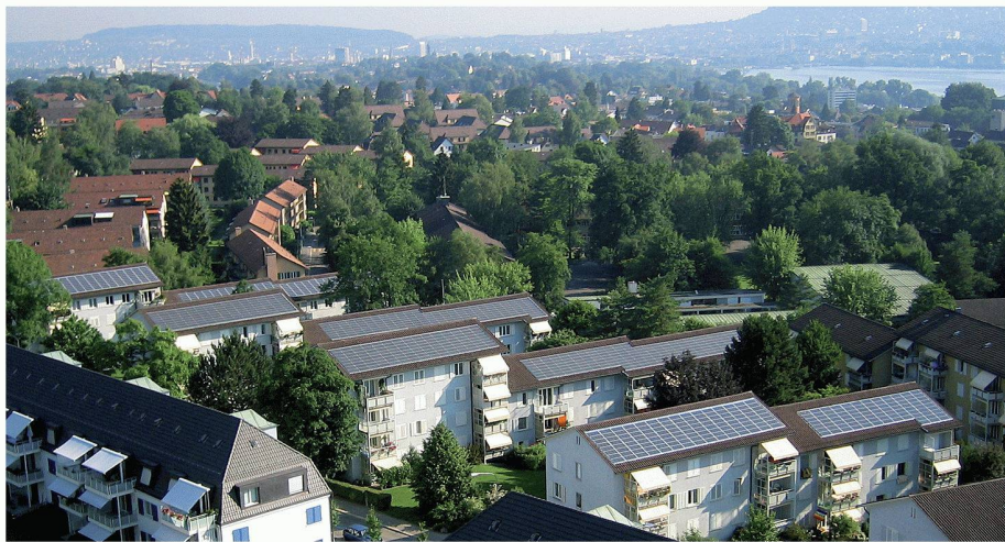
01 Strom von den Dächern einer Zürcher Baugenossenschaft

Sonnenkollektoren und Fotovoltaik-Module können teilweise auch in engen städtischen Verhältnissen platziert werden. Eine dreidimensionale Simulation erlaubt, die jeweiligen Möglichkeiten abzuschätzen.