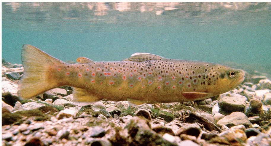
01 Damit sich der Bestand an Bachforellen erholt, müssen Wasserbau und Kraftwerksbetreiber deren Lebensraum verbessern, und die Stoffeinträge aus Landwirtschaft und Kläranlagen müssen reduziert werden

Seit Jahren gehen den Fischern in der Schweiz immer weniger Forellen an den Haken. Verantwortlich für die Bestandsreduktion sind der schlechte Zustand der Lebensräume, chemische Belastungen im Wasser und die Fischkrankheit PKD. Ein kürzlich lancierter 10-Punkte-Plan zeigt, welche Massnahmen es für eine Verbesserung der Lebensbedingungen von Fischen braucht.