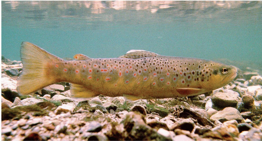
01 Damit sich der Bestand an Bachforellen erholt, müssen Wasserbau und Kraftwerksbetreiber deren Lebensraum verbessern, und die Stoffeinträge aus Landwirtschaft und Kläranlagen müssen reduziert werden

Seit Jahren gehen den Fischern in der Schweiz immer weniger Forellen an den Haken. Verantwortlich für die Bestandsreduktion sind der schlechte Zustand der Lebensräume, chemische Belastungen im Wasser und die Fischkrankheit PKD. Ein kürzlich lancierter 10-Punkte-Plan zeigt, welche Massnahmen es für eine Verbesserung der Lebensbedingungen von Fischen braucht.