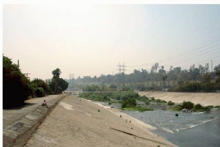
03 Im Bereich von Downtown L.A. (Glendale) ist der L.A. River ein breiter und betonierter Kanal