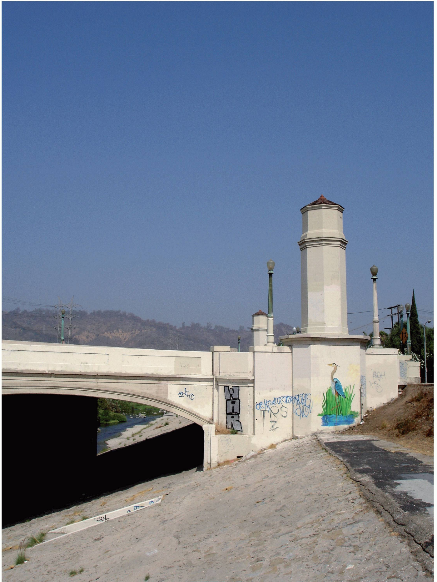
02 Die Strassenabwässer laufen direkt in den L.A. River und sind neben dem Abfall eines der Hauptprobleme der Umweltverschmutzung