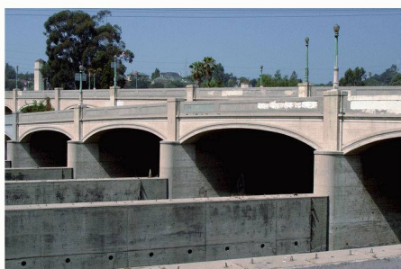
05 Mit betonierten Mauern wird versucht, die Fluten im Winter in Bahnen zu halten

liert werden, um neue Wasserkanäle als Seitenarme zu errichten und den Wasserspiegel zu senken. In letzter Konsequenz muss Land hinzugekauft werden, um den Kanal zu erweitern. Dennoch bleibt der Fluss ein kontrollierter Wasserkanal. Konkrete Steuerungsmöglichkeiten erfolgen auch über die Wasserkapazität und die Wassergeschwindigkeit und müssen beim Rückbau der Uferzonen und deren Begrünung berücksichtigt werden. Denn die Vegetation bremst die Kapazität, weshalb als Ausgleich der Kanal tiefer oder breiter werden müsste. Um die Spitzengeschwindigkeiten des Flusses von 6 bis 9 m/Sekunde zu regulieren, müssen Auffangbecken ausserhalb des Kanals errichtet werden, um die Geschwindigkeiten auf gut 3,5 m/pro Sekunde zu senken. Dies wird gleichzeitig die Vegetation an den Ufern unterstützen, da weder der Beton noch die Pflanzen weggewaschen werden.