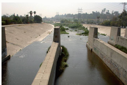
04 In spätestens 50 Jahren sollen hier zu beiden Seiten des Ufers Fahrradwege und schattenspendende Bäume eine Oase für Mensch und Tier bilden