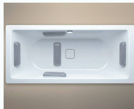
Franz Kaldewei GmbH & Co. KG | D-59206 Ahlen www.kaldewei.com

Ein zweiter Entwurf von Phoenix Design ist das Ornament «Lilie» für Duschwannen. Die zarten Blütenornamente in Grautönen harmonisieren mit den aktuellen Trends in der Badgestaltung. Ob kombiniert mit Holz- oder Steinboden, Natursteinen oder schlichten Fliesen – das dezente Muster zaubert einen Hauch von Exotik in moderne Badezimmer. Für zuverlässige Haltbarkeit und Beständigkeit werden die Ornamente in einem speziellen Emailverfahren dauerhaft in die Oberfläche eingebrannt, so dass die floralen Muster eine feste, untrennbare Verbindung mit der Duschfläche eingehen.