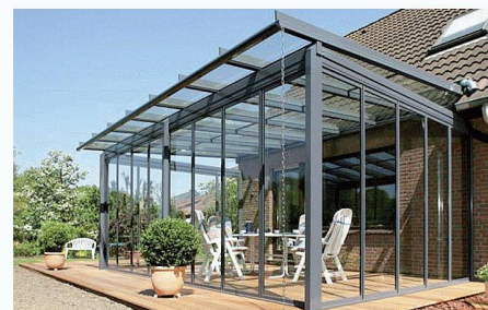
Solarlux (Schweiz) AG | 4415 Lausen www.solarlux.ch

terialauswahl ganz auf Langlebigkeit und hohe Stabilität ausgelegt. Dabei werden Aluminiumprofile mit Stahlarmierungen in den Sparren, Traufen und Stützen verstärkt oder statt verwindungsanfälligen Massivholzes Leimbinder aus Furnierschichtholz mit hoher Formstabilität verwendet. So können auch deutlich grössere Spannweiten realisiert werden.