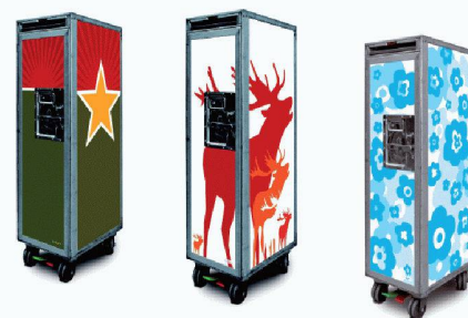
bordbar | D-50933 Köln www.bordbar.de

sen aufbewahrte, kann für Kleinigkeiten wie Schlüssel, Telefon oder im Büro für Briefumschläge verwendet werden. Zum Öffnen der Tür wird der Hebel nach oben geschoben (open – close). Sie lässt sich um 270° drehen und liegt somit an der Aussenseite an. Ein Magnet sichert die Tür. Im Inneren befinden sich 27 Führungen für Schubkästen und Regalböden. Sie garantieren eine flexible Inneneinteilung. Für den sicheren Stand sorgt eine Fussbremse. «Bordbar» bietet eine Vielzahl an Mustern an. Diese werden als digital bedruckte Folie aufgetragen und können auf der Website ausgewählt werden.