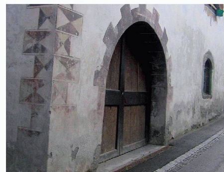
Atheco AG | Halle 2, Stand B 13 www.atheco.ch

Form von Gift- und Konservierungsstoffen zu verzichten. Der Micro-Pore-Entfeuchtungsputz ist hoch wasserdampfdurchlässig und sorgt für eine dauerhafte Abtrocknung von feuchten Mauern. Durch die spezielle Mikroporen- und Kapillarenstruktur verdunstet das im Mauerwerk befindliche Wasser sehr schnell, und gleichzeitig wird der Weitertransport von Wasser in flüssiger Form verhindert. Die Salze gelangen somit nicht an die Oberfläche. Problemwände sowohl im Innen- wie im Aussenbereich können mit diesem Produkt nachhaltig und kostengünstig saniert werden.