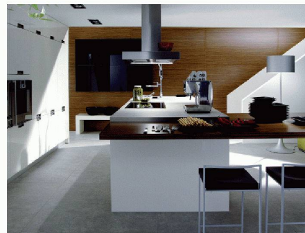
Hans Eisenring AG | Halle 3, Stand C 20 www.eisenring-kuechenbau.ch

ihre individuelle Küchenplanung dreidimensional miterleben. Die Anwendung dieser Technologie steigert die Effizienz und fördert die Kreativität und Spontanität des Kunden während der Planungs- und Beratungsphase. Die effektiven Kosten sind im Vergleich zum Budgetrahmen jederzeit ersichtlich. An der Messe können sich Kunden von Mitarbeitern der Firma Hans Eisenring beraten lassen.