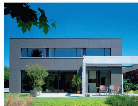
Eternit (Schweiz) AG | Halle 1, Stand A 20 www.eternit.ch

oder Renovationen, die Fassaden- und Dachlösungen von Eternit bestechen durch hohe Funktionssicherheit, Wertbeständigkeit und wirtschaftliche Nutzung über Jahrzehnte. Die äusserst dauerhaften, praktisch unterhaltsfreien Faserzementplatten schützen die Gebäudestruktur zuverlässig vor jeder Witterung. An der Messe erhalten Besucherinnen und Besucher einen Einblick in das breite Spektrum an Gestaltungsmöglichkeiten mit den Eternit-Produkten. Ein besonderes Highlight sind die neuen Fassadenfarbreihen «Nobils», «Planea» und «Terra».