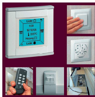
Hager Tehalit | Halle 6, Stand C 16 www.hager-tehalit.ch

Bei Renovationen und Umbauten empfiehlt Hager Tehalit das SL-Sockelleisten-System. Anschlüsse für elektrische Energie, Rundfunk- und Fernsehsignale oder Kommunikations- und Datennetze können mit sehr geringem Montageaufwand installiert werden.