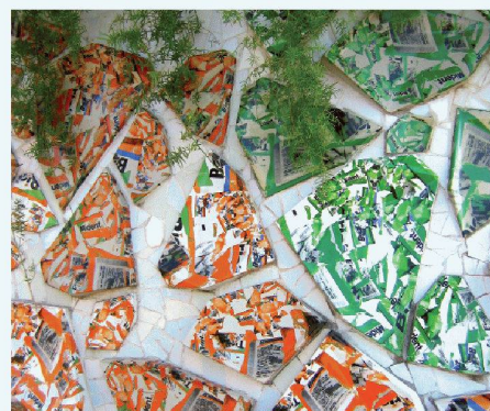
03 Moderne Mosaik à la Gaudí mit Zeitungstext verzieren die schwebenden Blumentöpfe

„ Wir sind in Nürnberg dabei, weil wir auf der Chillventa mit unserer MSR-Technik eine wichtige Rolle spielen. “