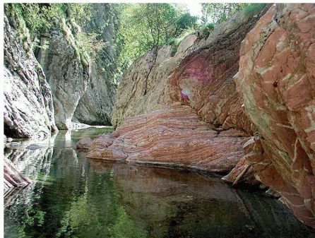
01 Auf rund 1.5 km Länge bietet die Breggia-Schlucht eindruckliches Anschauungsmaterial für 80 Mio. Jahre Erdgeschichte

(sda/km) Der Geo-Park in der Breggia-Schlucht in der Nähe von Chiasso wird um eine Attraktion reicher: Auf dem Gelände eines stillgelegten Zementwerks wird ein Zementlehrpfad eingerichtet. Das Konzept für die Neugestaltung des Fabrikgeländes wurde von Vertretern der Park-Stiftung, des