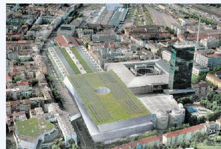
02 Die unter Schutz gestellte Rundhofhalle von Hans Hofmann von 1954. Im Hintergrund der zum Abbruch freigegebene Kopfbau der Messehalle 1 von Hermann Herter von 1926

restaurant «Alte Warteck» und angrenzenden Bauten am Riehenring. Auch hier besteht der Basler Heimatschutz auf einer Unterschutzstellung. Zusammen mit der freiwilligen Denkmalpflege hat er Anfang August einen Rekurs gegen den Regierungsentscheid eingereicht. Die Gebäudehüllen und die traditionellen Gaststättenräume seien hochwertige Zeitzeugen, ihr Abbruch würde für Kleinbasel einen grossen Verlust an Wohnlichkeit und Identität bedeuten. Die Regierung war mit ihrem Entscheid nicht der Empfehlung des Denkmalrates gefolgt, der sowohl das «Alte Warteck» wie den Kopfbau der Messehalle 1 für schützenswert befunden hatte.