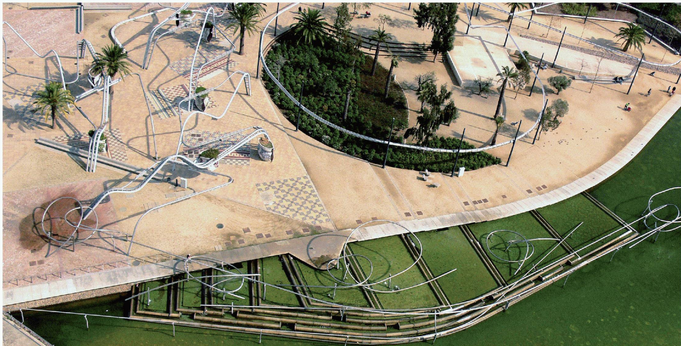
01 Ein Geflecht von Metallrohren zieht sich ebenso wie das Thema «Mosaik» durch den Parc Diagonal Mar (1997–2002) von EMBT in Barcelona (Bild: EMBT)

In einem ehemaligen Industriequartier, unweit des Kongresszentrums «Forum» von Herzog & de Meuron gelegen (TEC21 H. 27-28/2007, S.11), soll der Parc Diagonal Mar in Barcelona von EMBT Architekten zwischen Meer und Stadt vermitteln. Enrique Miralles bezeichnete ihn selbst als «Baum, der seine Wurzeln im Meer hat» – ein Baum von 14 000 ha Fläche, neben dem Parc Güell und dem Parc de la Ciutadella der drittgrösste Park der katalanischen Millionenstadt.