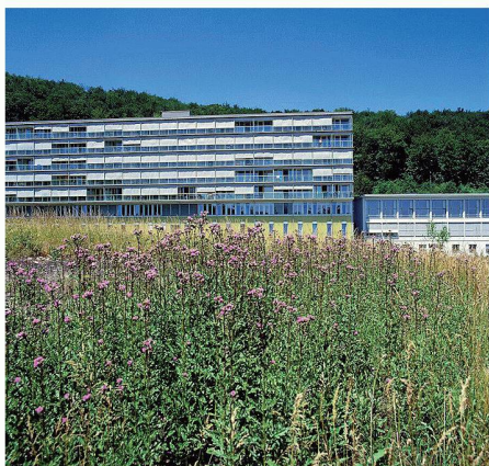
01 Klinik Barmelweid: Umgebung im Sommerflor

(sda/km) Die Klinik Barmelweid, oberhalb von Erlinsbach AG gelegen, will ihre 18 ha grosse Umgebung in einen Biodiversitätspark mit urtümlichen Nutztieren und -pflanzen umwandeln. Der Park soll in Zusammenarbeit mit dem Naturmuseum Naturama in Aarau