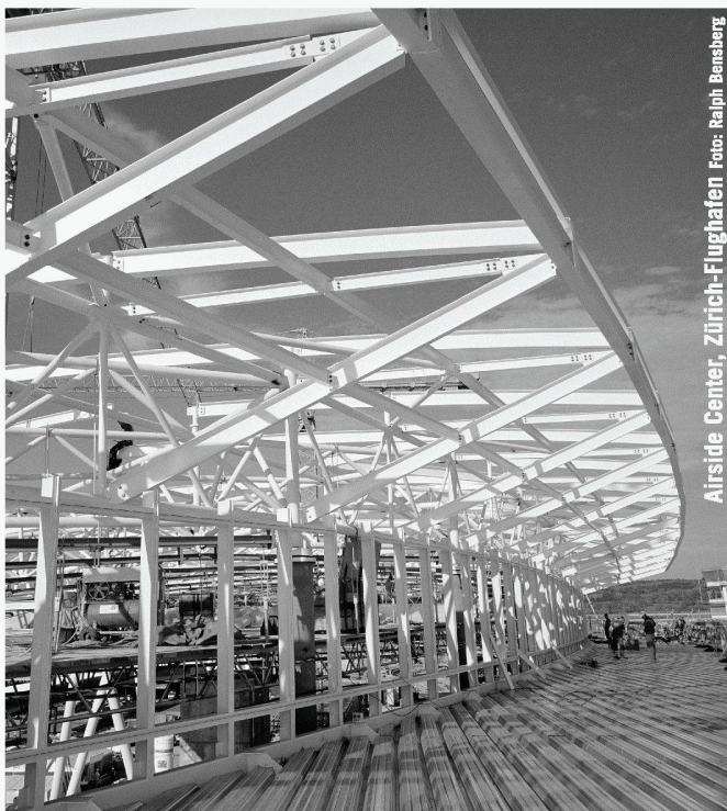
Airside Center, Zürich-Flughafen

Messezentrum Zürich www.bauen-modernisieren.ch