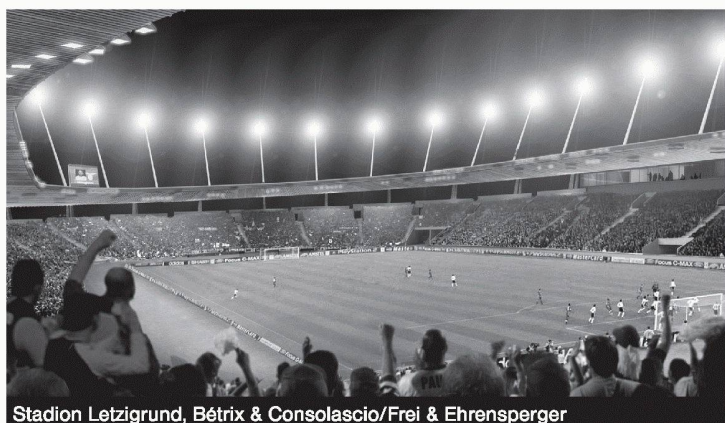
Stadion Letzigrund, Bétrix & Consolascio/Frei & Ehrensperger