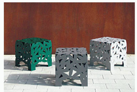
Miramondo | A-1030 Wien www.miramondo.com

Wandflächen erzeugt. Der Sitzwürfel hat eine Kantenlänge von 50cm und wiegt stolze 23 kg. Er ist in vier Farben (hellgrau, dunkelgrau, grün, rot) erhältlich.