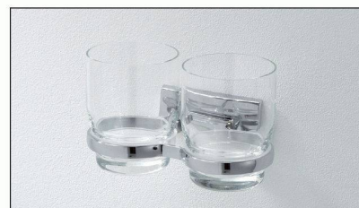
Das neue, noch einmal reduzierte Design der Accessoires-Serie CHIC von Bodenschatz. Jetzt erhältlich!

Wer die Bäder von Mietwohnungen mit CHIC ausstattet, ist auf der sicheren Seite: Die Kombination „günstiger Preis für langlebige und schöne Accessoires“ findet bei der Bauherrschaft ebenso Gefallen wie bei den Mieterinnen und Mietern. Sicherheit verspricht auch die Nachliefergarantie für neue und für bisherige Modelle. Umfassende Informationen zu CHIC sind erhältlich bei der Bodenschatz AG.