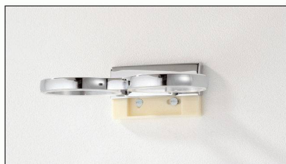
Der Flansch wird an der Wand befestigt, die Accessoires werden ganz einfach darüber geschoben.