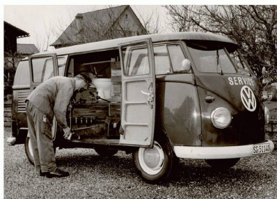
Zeitsprünge: Als dieses Sanitätservice-Auto zum Einsatz kam, war CHIC von Bodenschatz bereits 10-jährig (Bild Schenk-Bruhlin, Sargans 1967)

Im Jahre 1957 revolutionierte die Schweizer Firma Bodenschatz den Markt der Badezimmer-Accessoires auf nachhaltige Art und Weise. Die Produkte ihrer innovativen Accessoires-Serie – der legendären CHIC – waren die ersten, die indirekt – über einen Flansch – an der Wand angeschraubt wurden. Ein Kunststoffteil wird an der Wand angeschraubt, die Accessoires ganz einfach darübergeschoben. Dank dieser Erfindung waren und sind die Befestigungsschrauben nicht mehr sichtbar und der einmalige Siegeszug durch die Schweizer Badezimmer nahm seinen Lauf.