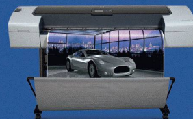
Der neue Designjet T1100 & T610

Für die besten Resultate verwenden Sie original HP-Produkte.