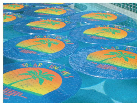
Fun-Care AG | 6300 Zug www.solarsunrings.ch

täglichen Energieleistung eines Rings können 5500 l Wasser um 1 °C pro Sonnentag erwärmt werden. Bei einer Abdeckung des Schwimmbads von 67 % wird das Verdunsten von Wasser um 64,3 % reduziert. Weiter haben die Tests ergeben, dass bei dieser Abdeckung 50 % weniger Chlor verdunstet. Zudem kühlt der Pool über Nacht weniger aus, und die Algenbildung im Wasser war, im Vergleich zu herkömmlichen Solarheizfolien, massiv kleiner. «Solar Sun Rings» sparen Energie und Wasser und reduzieren die Unterhaltskosten für Poolanlagen.