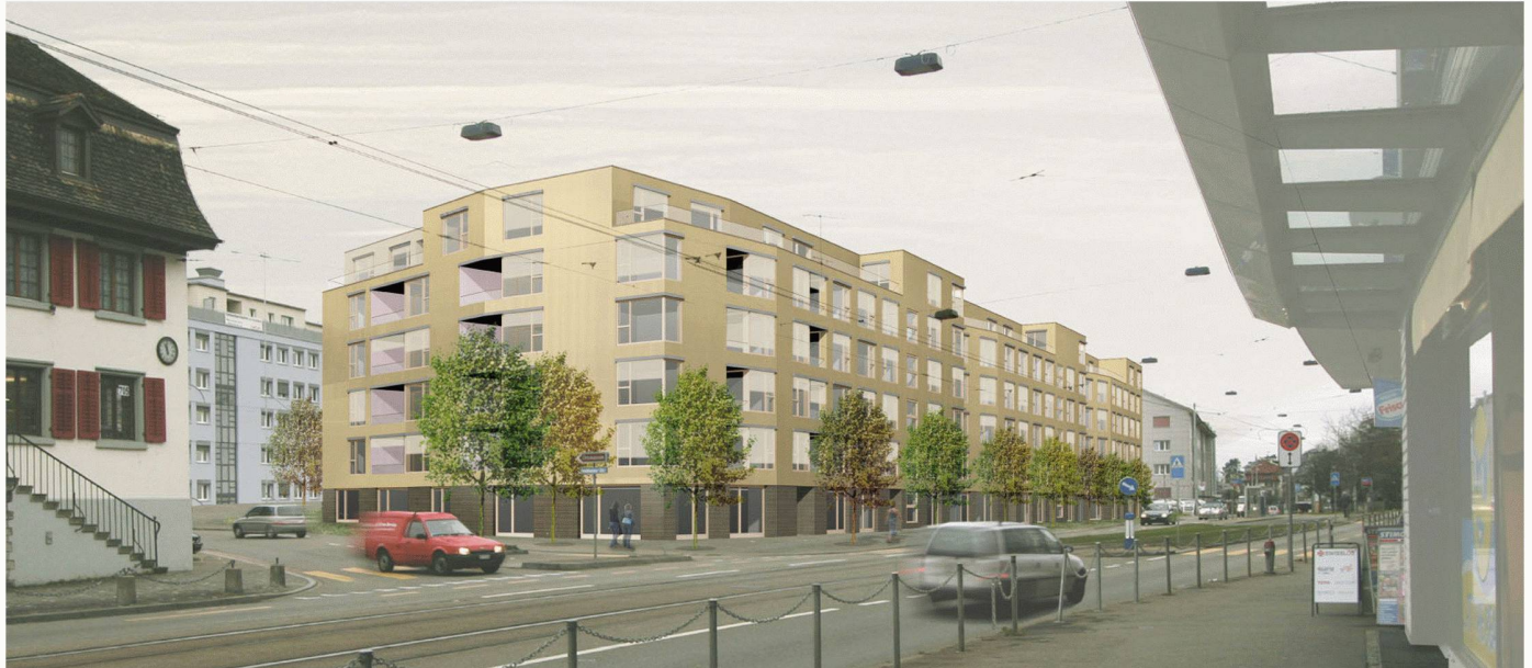
Der leicht bewegte, kompakte Wohnblock fügt sich angemessen ins Strassenbild

An der Badenerstrasse in Zürich Altstetten soll eine Wohnüberbauung mit attraktiven und marktfähigen Mietwohnungen entstehen. Dazu haben die Grundeigentümer Peter Halter Liegenschaften AG und Halter Generalunternehmung AG vier Architekturbüros mit der Ausarbeitung einer Studie beauftragt. Die erste Stufe wurde als anonymer Studienauftrag in Anlehnung an die SIA-Ordnung 142 durchgeführt. Das Beurteilungsgremium beschloss, zwei Studien in einer zweiten, nicht anonymen Stufe überarbeiten zu lassen. Überzeugend scheint die Begründung zur Aufhebung der Anonymität nicht, war das Programm doch klar definiert und kein Bedürfnis nach einer Präzisierung im direkten Dialog ersichtlich. Die Auswahl der eingeladenen Teilnehmer sollte zudem sicherstellen, dass alle die Voraussetzungen erfüllen, um die Architekturleistungen für