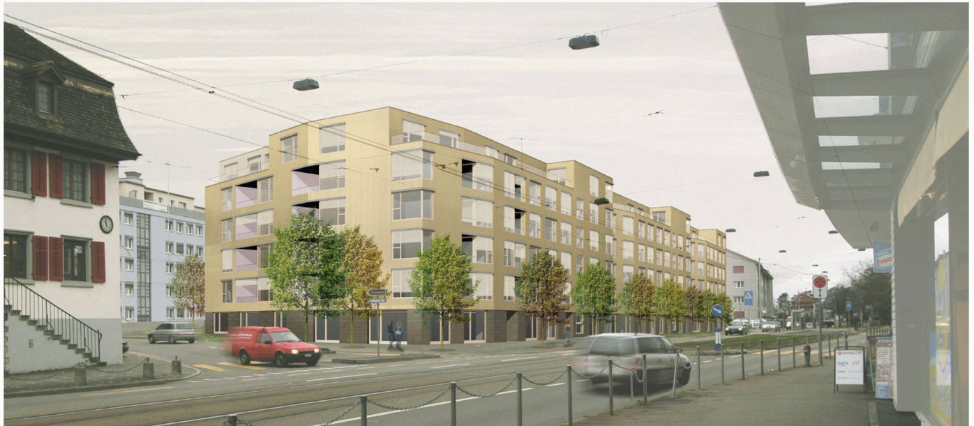
Der leicht bewegte, kompakte Wohnblock fügt sich angemessen ins Strassenbild (Visualisierung, von Ballmoos Krucker Architekten, Zürich)

An der Badenerstrasse in Zürich Altstetten soll eine Wohnüberbauung mit attraktiven und marktfähigen Mietwohnungen entstehen. Dazu haben die Grundeigentümer Peter Halter Liegenschaften AG und Halter Generalunternehmung AG vier Architekturbüros mit der Ausarbeitung einer Studie beauftragt. Die erste Stufe wurde als anonymer Studienauftrag in Anlehnung an die SIA-Ordnung 142 durchgeführt. Das Beurteilungsgremium beschloss, zwei Studien in einer zweiten, nicht anonymen Stufe überarbeiten zu lassen. Überzeugend scheint die Begründung zur Aufhebung der Anonymität nicht, war das Programm doch klar definiert und kein Bedürfnis nach einer Präzisierung im direkten Dialog ersichtlich. Die Auswahl der eingeladenen Teilnehmer sollte zudem sicherstellen, dass alle die Voraussetzungen erfüllen, um die Architekturleistungen für