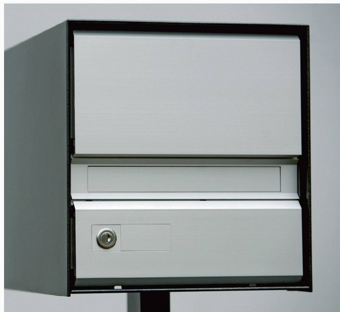
Typ classic S - Einzel - Mittelstütze

Als Spezialist für Briefkästen möchten wir Ihre Ideen und unsere Erfahrungen verbinden, um eine Lösung mit hohem Nutzwert in Funktion, Design und Preis zu erreichen.