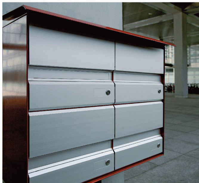
Typ classic B - Gruppe - Wandmontage - Regendach