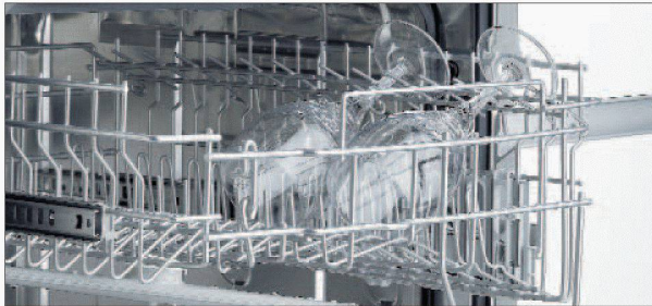
Komfortable Bedienung des Oberkorbs.