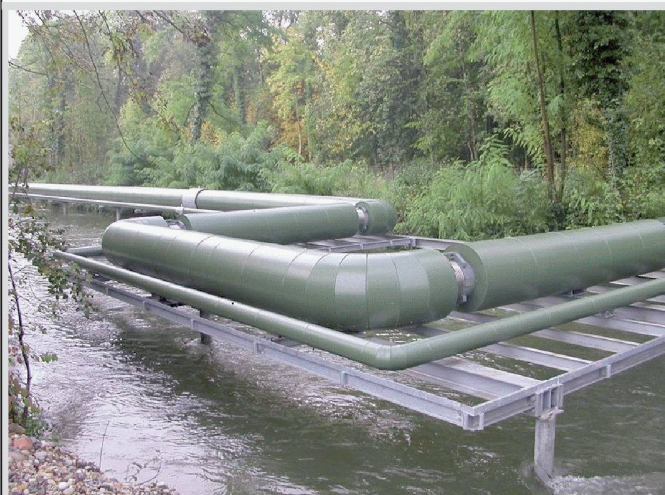
Dampfverbund Solothurn Ost

Wir sorgen für Ihr Wohlbefinden mit Sicherheitslösungen und Gebäudeautomation