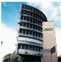
Gewerbe- und Wohnbau