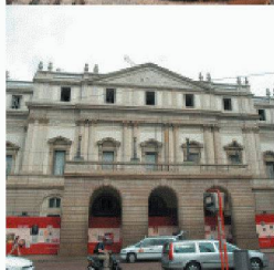
Neubauten in und an bestehenden Bauten

Durch die über 40-jährige Erfahrung und Spezialisierung auf vorbeugende und sanierende Abdichtung gegen drückendes Wasser, sowie ständige Weiterentwicklung der Produkte und Lösungen, können Sie mit RASCOR nur gewinnen.