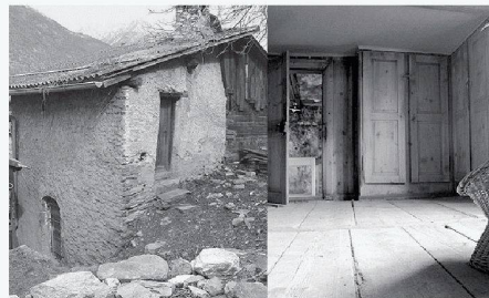
Blatterhaus, Gemeinde Turtmann VS