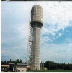
Behälter- und Bäderbau