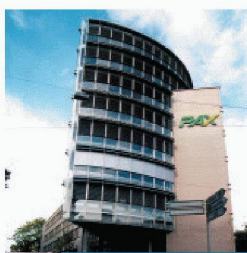
Gewerbe- und Wohnbau