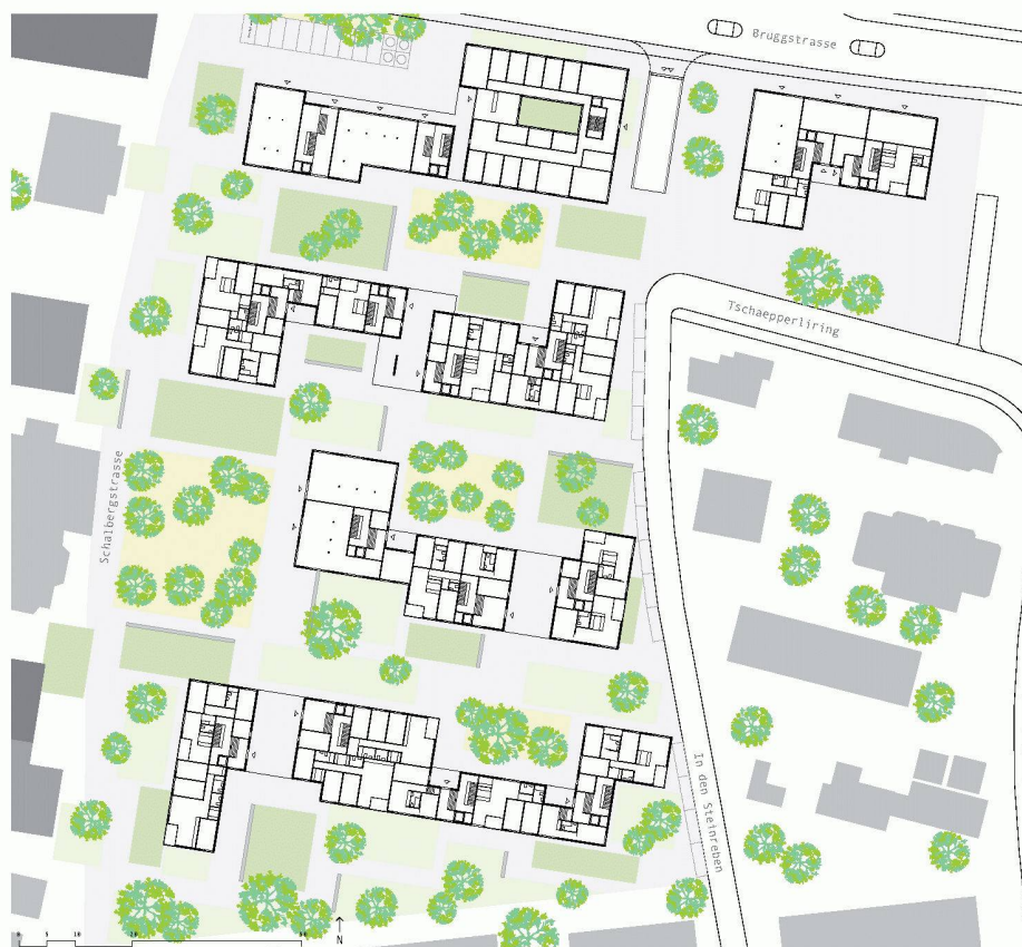
Im Zentrum von Reinach soll Grossmassstäbliches entstehen. Erdgeschoss und Modellbild (Weiterbearbeitung, sabarchitekten)