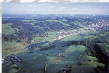
G. B. & la Guillaune

Die Neuenburger Städte Le Locle und La Chaux-de-Fonds schreiben zwei städtebauliche Wettbewerbe für die Gestaltung von zwei Örtlichkeiten aus. Es handelt sich um Le Crêt-du-Loche (zwischen den zwei Städten) und Le Col-des-Roches (nahe an der Grenze zu Frankreich). Die zwei Städte fördern eine Stadt- und Landschaftsplanung, die im Zeichen der Qualität und der nachhaltigen Entwicklung steht. Beide im Wettbewerb ausgeschriebenen Örtlichkeiten befinden sich entlang der Linie des TransRUN, ein im Rahmen der neuen Agglomerationspolitik entwickeltes Projekt einer regionalen S-Bahn zur Verbindung der höher gelegenen Region mit der tiefer gelegenen Region des Kantons. Die zwei Städte wurden vom Bund für die Liste des UNESCO-Weltkulturerbes vorgeschlagen. Dieses einzigartige Stadtensemble zeugt von ausserordentlicher Architektur und Geschichte der Uhrendindustrie.