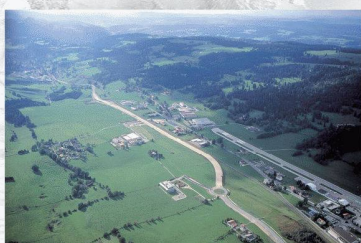
G. B. & la Guillaune